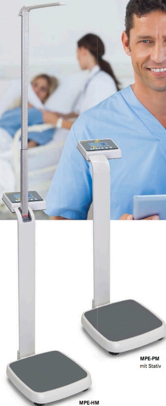
MPE-PM mit Stativ