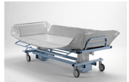
Seitengitter herunter klappbar.

Die stabilen Seitengitter sorgen dafür, dass die Person während des Transports gegen ein Herunterfallen vom Duschwagen abgesichert ist. Für die Übernahme der Person lassen sich die Seitengitter leicht herunterklappen. Des Weiteren verfügt der Duschwagen über eine zentrale Feststellbremse, die alle 4 Leichtlaufrollen gleichzeitig gegen das Wegrollen sichert. Auch verfügt der Duschwagen über eine Geradeauslaufhilfe, die besonders für lange Gänge geeignet ist. Die Liegefläche kann in zwei Positionen verstellt werden, flach für die Übernahme des Patienten oder geneigt für den Transport, das Duschen und für den besseren Ablauf des Wassers. Im Lieferumfang sind die Liegepolsterung, 2 aufladbare Batterien, ein Ablaufschlauch und die Hand-Kabelfernbedienung enthalten.