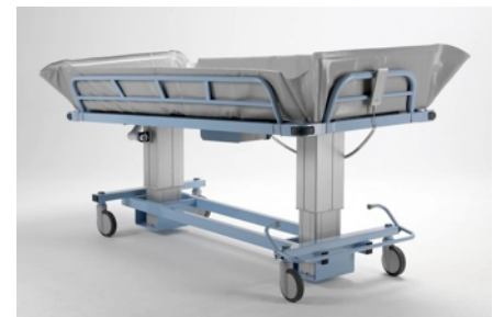
Neigungsverstellung für die Schocklage oder für den schnellen Wasserablauf