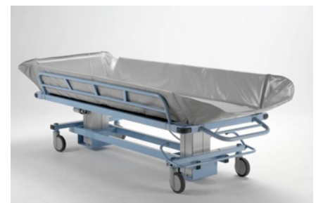
Kopfgitter herunter klappbar.