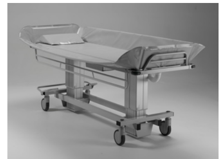
Seitengitter Waagrecht oder herunterklappbar.

Die stabilen Seitengitter sorgen dafür, dass die Person während des Transports gegen ein Herunterfallen vom Duschwagen abgesichert ist. Für die Übernahme der Person lassen sich die Seitengitter leicht herunterklappen. Des Weiteren verfügt der Duschwagen über eine zentrale Feststellbremse, die alle 4 Leichtlaufrollen gleichzeitig gegen das Wegrollen sichert. Auch verfügt der Duschwagen über eine Geradeauslaufhilfe, die besonders für lange Gänge geeignet ist. Die Liegefläche kann in zwei Positionen verstellt werden, flach für die Übernahme des Patienten oder geneigt für den Transport, das Duschen und für den besseren Ablauf des Wassers. Im Lieferumfang sind die Liegepolsterung, 2 aufladbare Batterien, ein Ablaufschlauch und die Hand-Kabelfernbedienung enthalten.