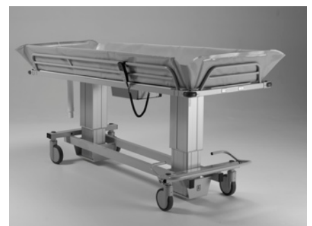
Neigungsverstellung für die Schocklage oder für den schnellen Wasserablauf